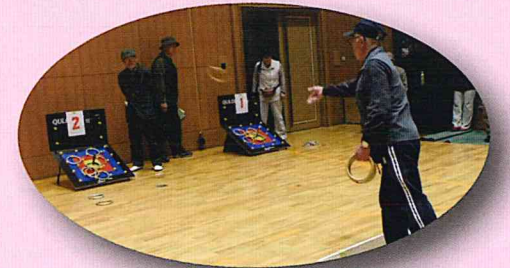
クロリティー(輪投げ)