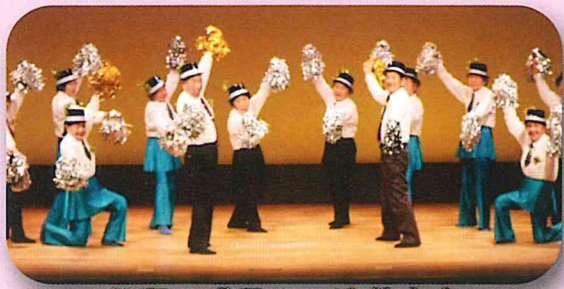
日頃の成果を…演芸大会