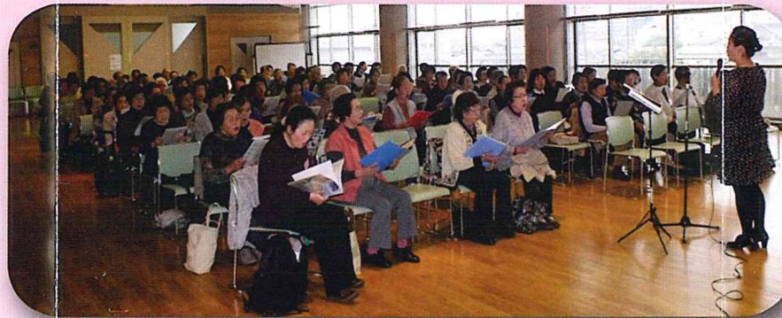
シルバーコーラス(月2回)100人以上が参加