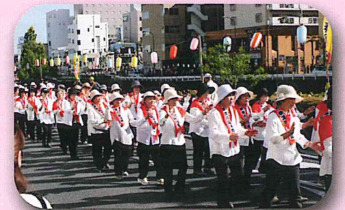
たばこ祭たばこ音頭千人パレード