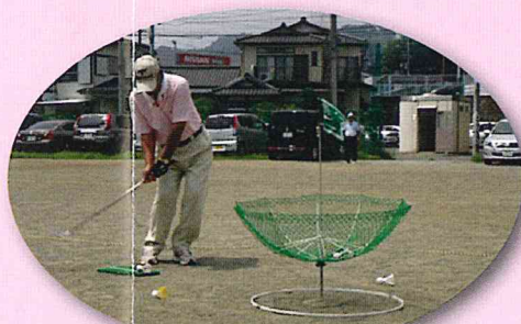
ターゲットパードゴルフ