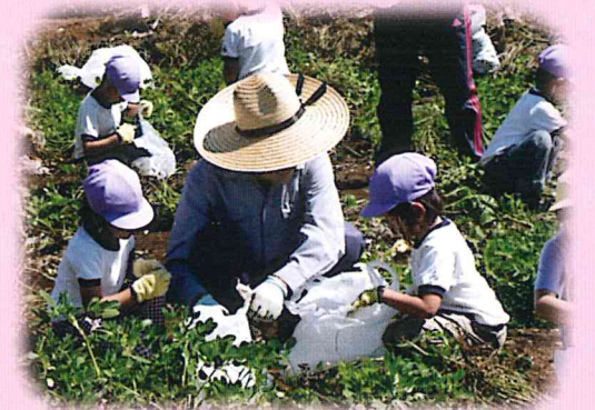
園児と収穫…ふれあい農園