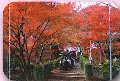
女性部交流日帰りバス旅行