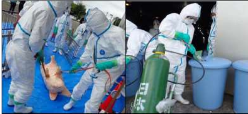
写真1 防疫訓練の様子