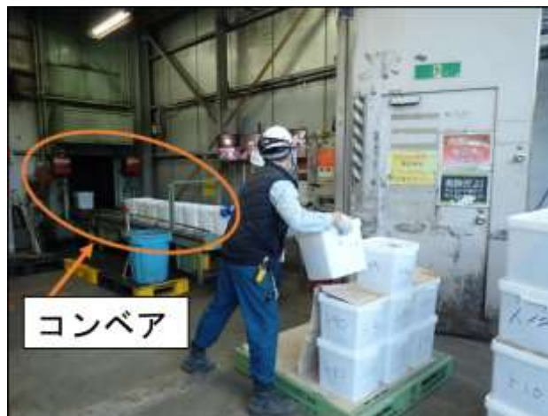
写真5 コンベアへの密閉容器の積載

荷下ろしした密閉容器は、ストレッチフィルムを開封し、密閉容器及びパレットの数量を確認する。数量確認時には、県の焼却担当が集積場所から搬出された数量と、施設に搬入した数量に差異がないか確認を行った。数量確認後、密閉容器を荷崩れ防止用のテープで固定し、フォークリフトを用いて自動投入装置の近くまで運搬し、自動投入装置に接続したコンベアへ密閉容器を積載した（写真5）。密閉容器が自動投入装置のセンサーに反応すると投入口が開き、自動で焼却炉へ投入される。