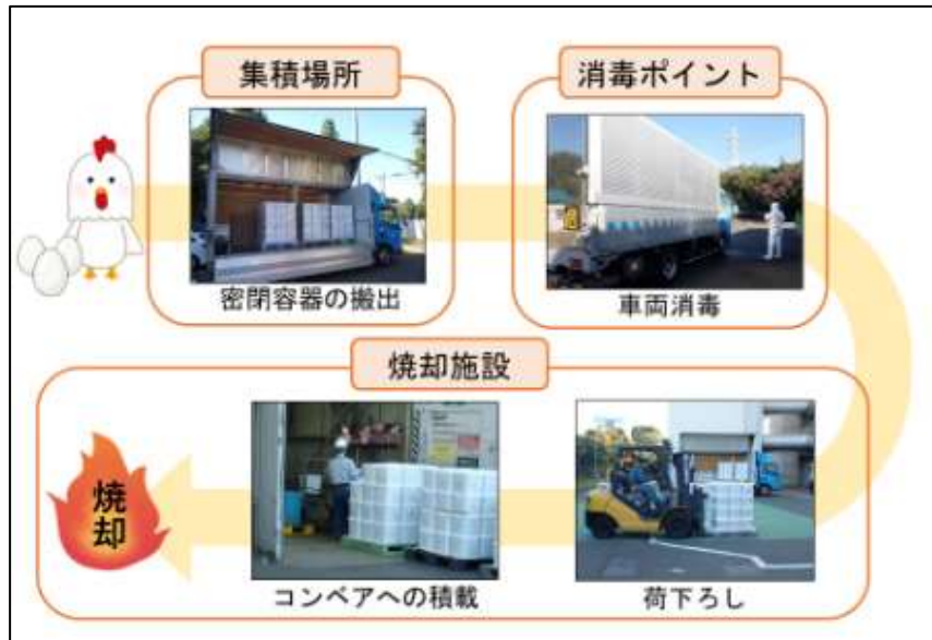
図1 実動訓練の流れ