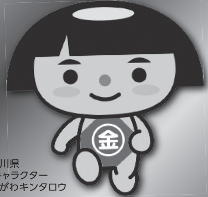
神奈川県 PRキャラクター かながわキンタロウ